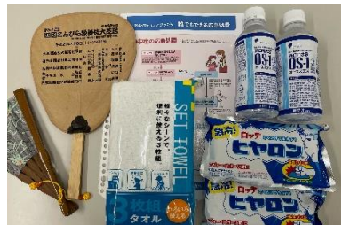
熱中症応急処置 フローチャート (環境省)